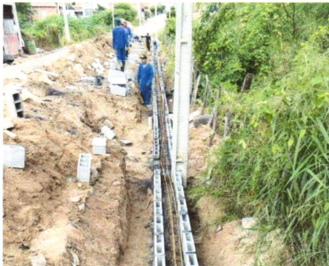
Foto 05 - ALVENARIA DE BLOCOS DE CONCRETO ESTRUTURAL 9X19X39 CM, (ESPESSURA 14 CM) FBK = 14,0 MPA, PARA PAREDES COM ÁREA LÍQUIDA MENOR QUE 6M 2 , SEM VÃOS, UTILIZANDO PALHETA. AF_12/2014