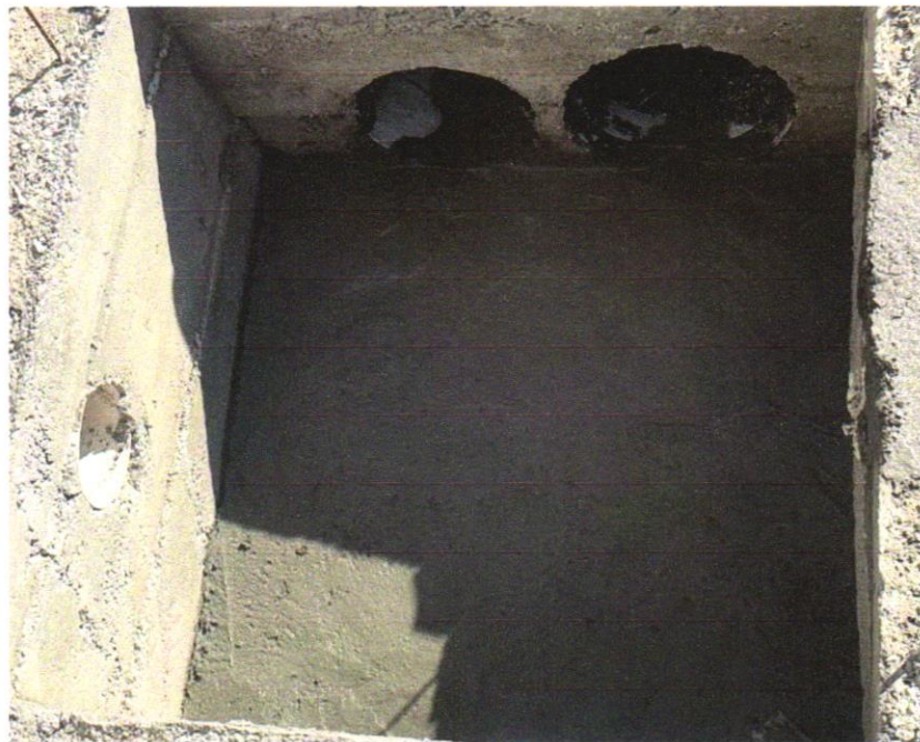
Foto 11 - CAIXA.