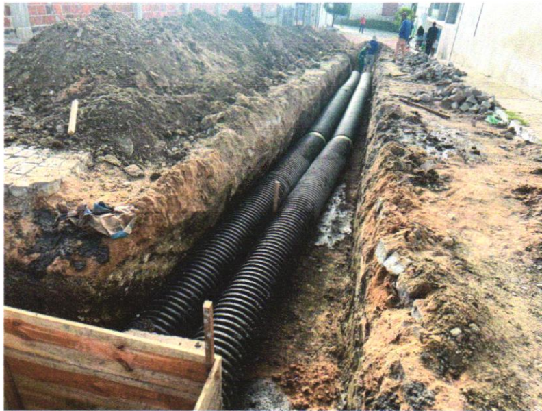
Foto 09 - TUBOS