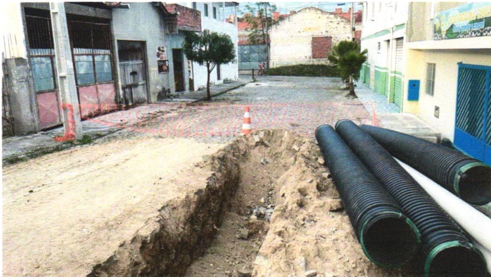
Foto 03 - ESCAVAÇÃO DE VALA